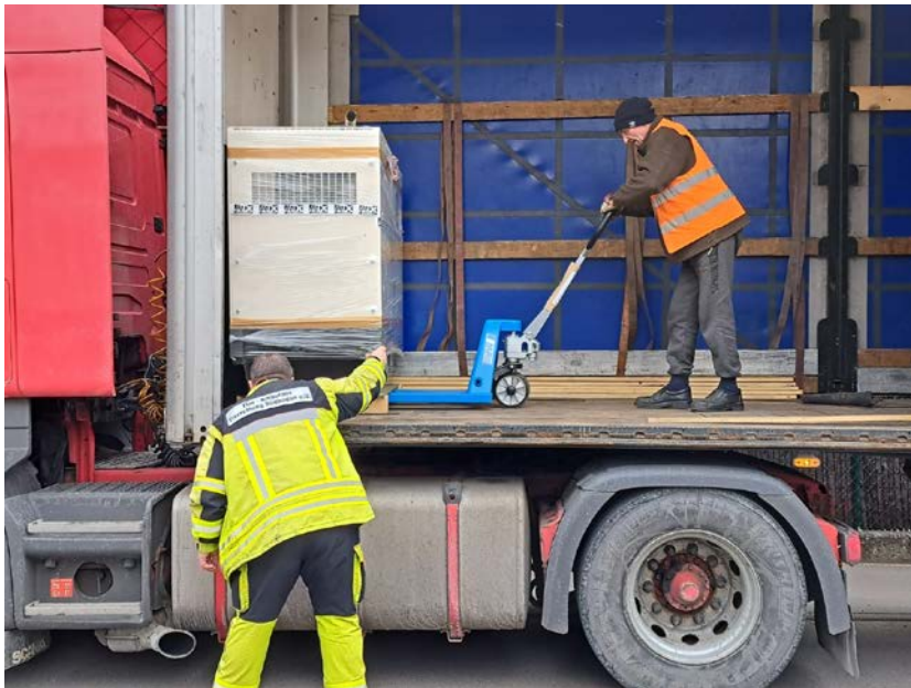
Bildunterschrift: Das Aggregat wird in Deutschland verstaут.