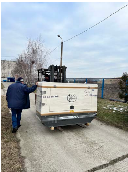
Bildunterschrift: Das Aggregat kommt im Tierschutzzentrum Odessa an.