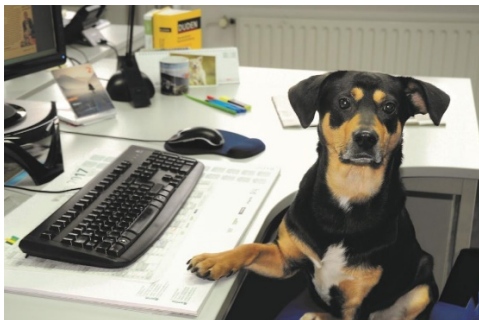
Bildunterschrift: Hund Buddy bei seiner „Arbeit“ beim Deutschen Tierschutzbund Download hier