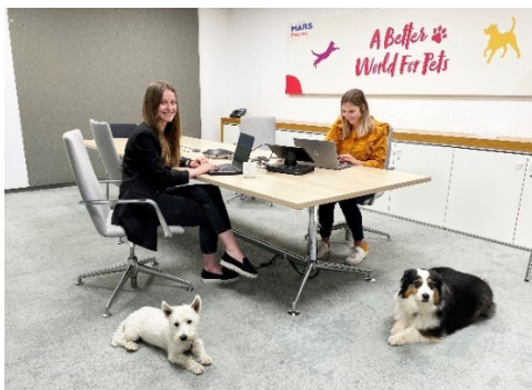
Bildunterschrift: Higgins und Flora leisten ihren Frauchen bei der Arbeit Gesellschaft. Download hier .

Weitere Fotos senden wir Ihnen auf Wunsch gerne zu.